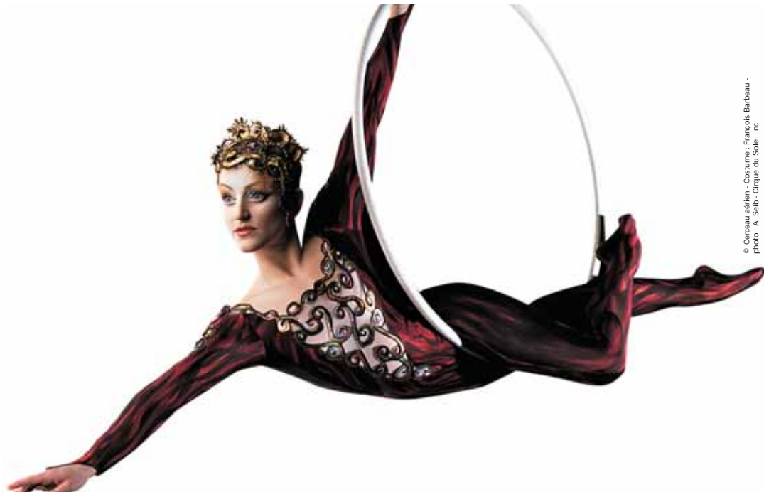
© Cercueil aéréien - Costume : François Barbeau - photo : Al Solib - Cirque du Soleil inc.