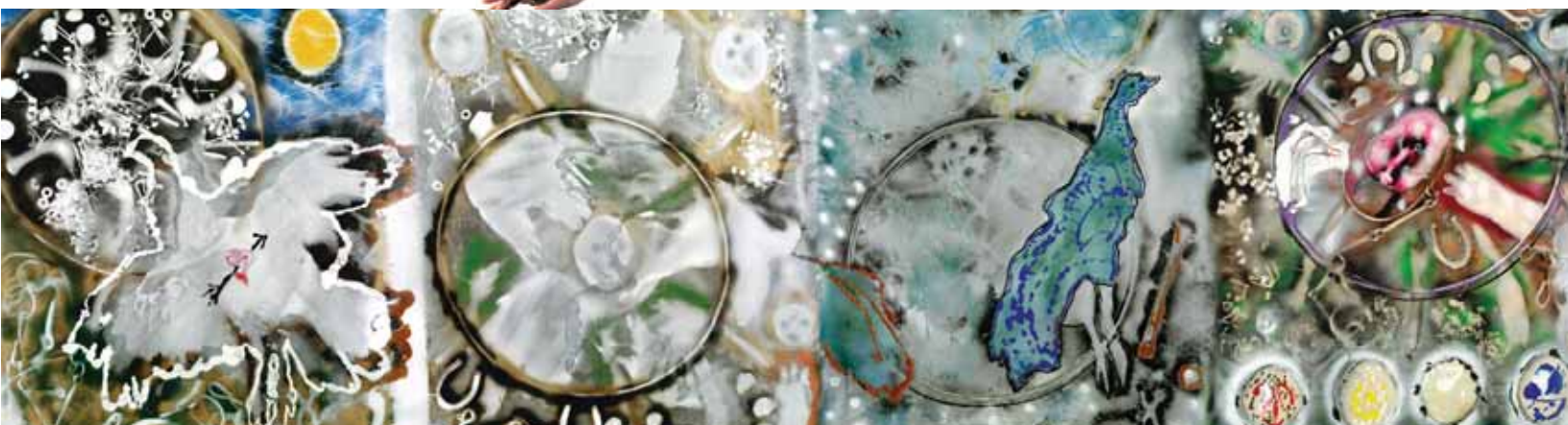
Jean-Paul Riopelle, L'Hommage à Rosa Luxemburg , (détail), 1992 © Succession Jean-Paul Riopelle / SODRAC - Musée national des beaux-arts du Québec