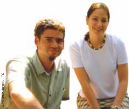
C. Parent / P. Hurléau - TQ

Depuis le début du 20 e siècle, quelque 700 000 immigrants venus d'Europe, d'Afrique, d'Amérique latine et d'Asie se sont joints à la société québécoise qui accueille aujourd'hui, en moyenne, plus de 35 000 nouveaux arrivants par an. La mixité des cultures donne un nouveau visage à la société québécoise, terre historique d'accueil, particulièrement à Montréal, métropole francophone d'Amérique.